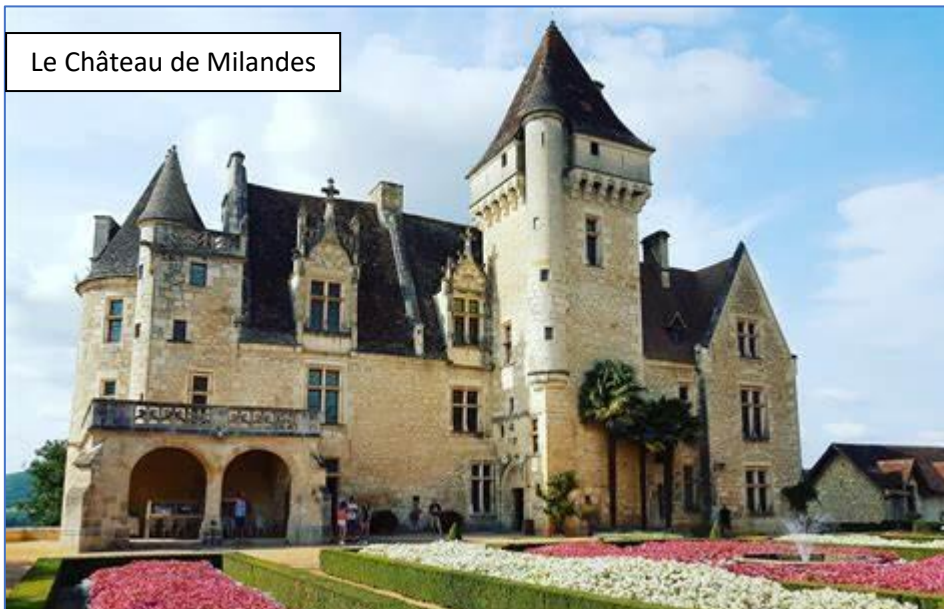
Le Château de Milandes